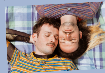
Short Ideas

Le bar de la Fabrique Théâtrale sera ouvert dès 16H pour l'occasion !