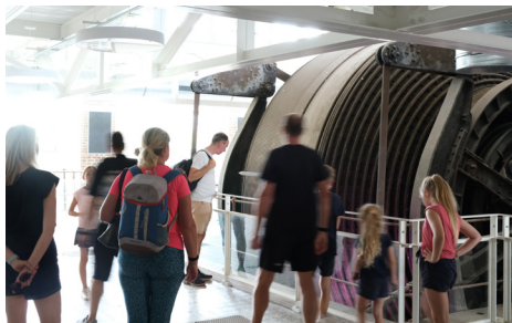
Visite de l'ancienne Salle des Machines