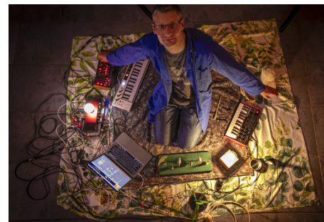
Sieste sonore